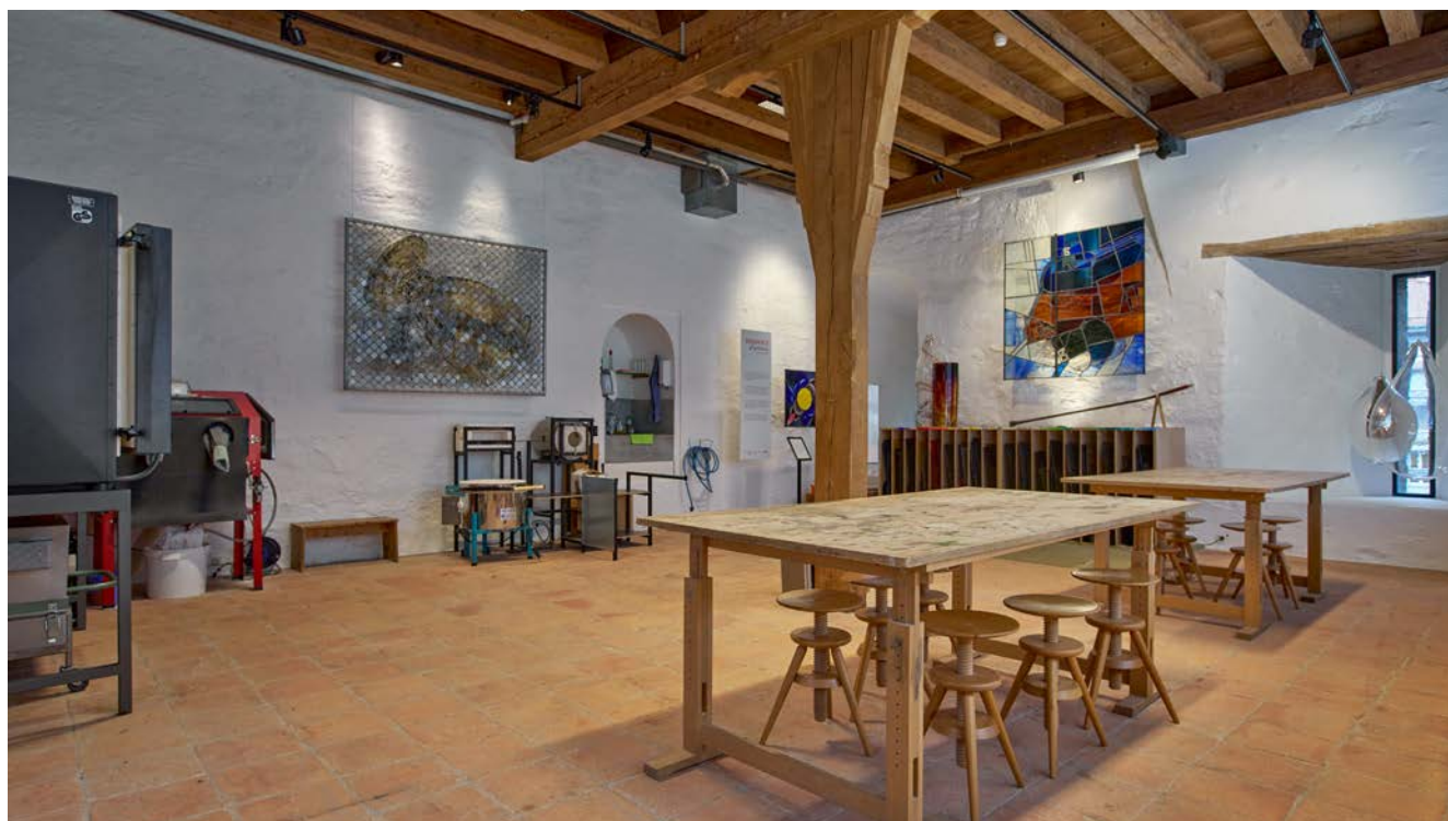
Fig. 1. Vue de l' Espace Michel Eltschinger .

L'atelier de médiation culturelle du Vitromusée Romont est un lieu hybride où se croisent différents acteur-trice-s, envies et besoins. Guides du musée y expliquant les techniques du verre, médiateur-trice-s organisant des ateliers