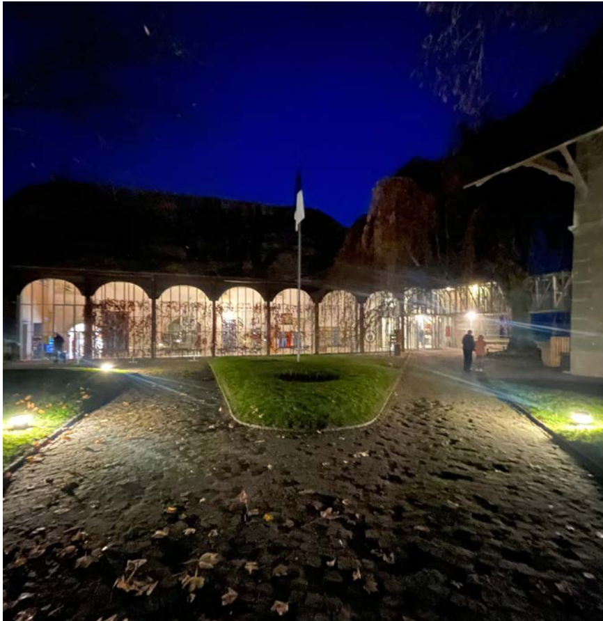
Fig. 7 : Vue du Vitromusée Romont de nuit.

Il y a eu un bel engouement pour cette soirée, qui a rassemblé 243 visiteur-euse-s. La programmation du Vitromusée Romont était complétée par celle de l'Office du Tourisme de Romont et sa région, qui avait organisé une visite guidée nocturne de la ville médiévale de Romont.