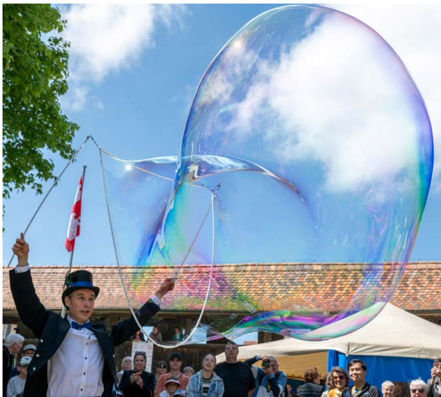
Fig. 5 : Bulles géantes par M. Papillon.

Les expositions « Matteo Gonet : Glassworks » et « RESOLVED » de Verarte (forum art verrier suisse) ont été inaugurées lors du Vitrofestival. Dans son atelier près de Bâle, l'artiste Matteo Gonet travaille avec 15 artisans et collabore avec les plus grands designers, artistes et architectes, repoussant toujours plus loin les frontières de sa discipline. Pour son exposition au Vitromusée Romont, il a eu carte blanche et a choisi d'exposer les « fantômes » du château (fig. 3). Parallèlement, l'exposition de Verarte a réuni les dernières créations de 17 membres de l'association et a mis ainsi en valeur la diversité des approches et techniques d'art verrier (fig. 4).