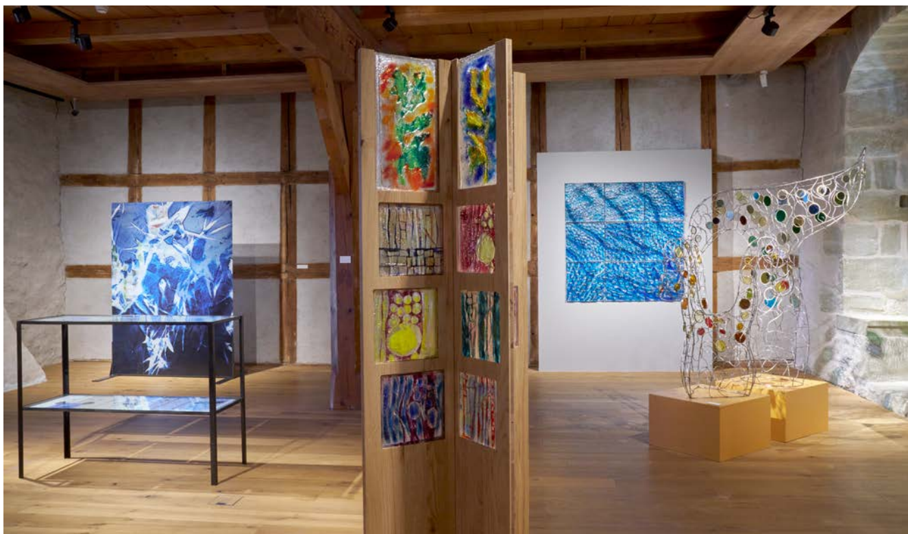
Fig. 4 : Vue de l'exposition « RESOLVED » de Verarte.