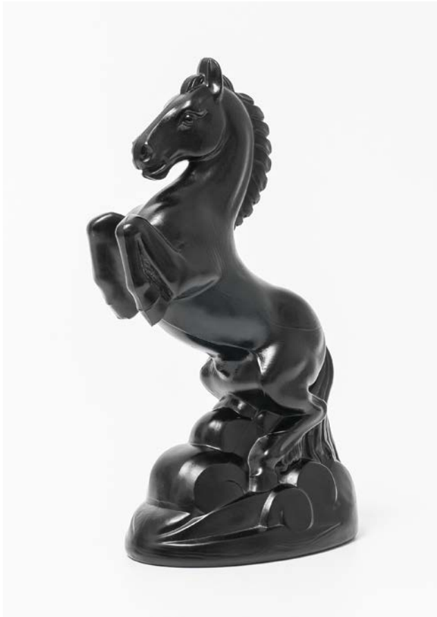
Fig. 12. Verrerie de St-Prex, 1939, cheval cabré, VMR VO 98.

À l'automne 1939, la production est suspendue en raison des restrictions liées à la guerre. Il faut alors attendre dix ans pour la parution d'un nouveau catalogue. En 1949, la Verrerie artistique présente trois modèles à la foire de Bâle. Parallèlement, une parure en galvanoplastie est introduite. Très décoratifs, ces ornements argentés apparaissent surtout dans un contexte commémoratif. Avec la liste de prix de 1960 disparaissent aussi l'empreinte de Bonifas et les analogies avec le verre vénitien. Sans avenir dans un contexte industriel en plein essor, la Verrerie artistique ferme définitivement le 24 décembre 1964. En 1974, Vetropack innove à nouveau et se tourne vers le recyclage du verre.