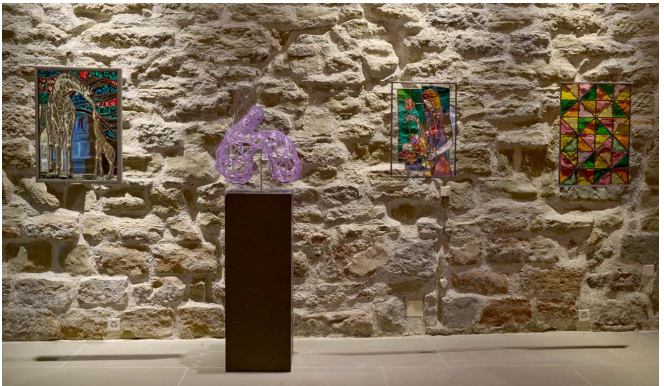
Fig. 4. Vue de l'exposition des 30 ans de l'APSV à la salle St-Luc.

Commissaire d'exposition : Jennifer Burkard, en collaboration avec l'APSV