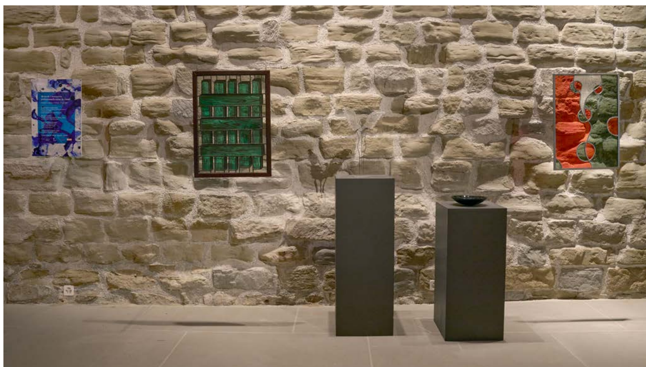
Fig. 1. Vue de l'exposition des 30 ans de l'APSV à la salle St-Luc.

L'Association œuvre dans un esprit d'entraide plutôt que de concurrence, réunissant parfois plusieurs ateliers sur les chantiers de grande envergure.