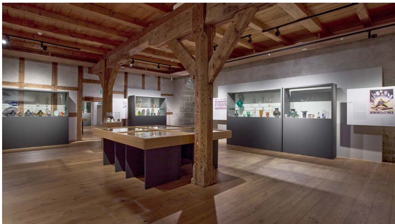
Fig. 1. Vue de l'exposition « La Verrerie artistique de Saint-Prex » dans les salles du Vitromusée Romont.

Après une introduction générale, consacrée aux débuts de la Verrerie de St-Prex, le parcours s'articulait en six sections, enrichies de documents d'archives, retraçant l'histoire de la branche artistique, projet audacieux à l'heure de l'avènement de la production verrière industrielle (figs. 1–3). Grâce à une