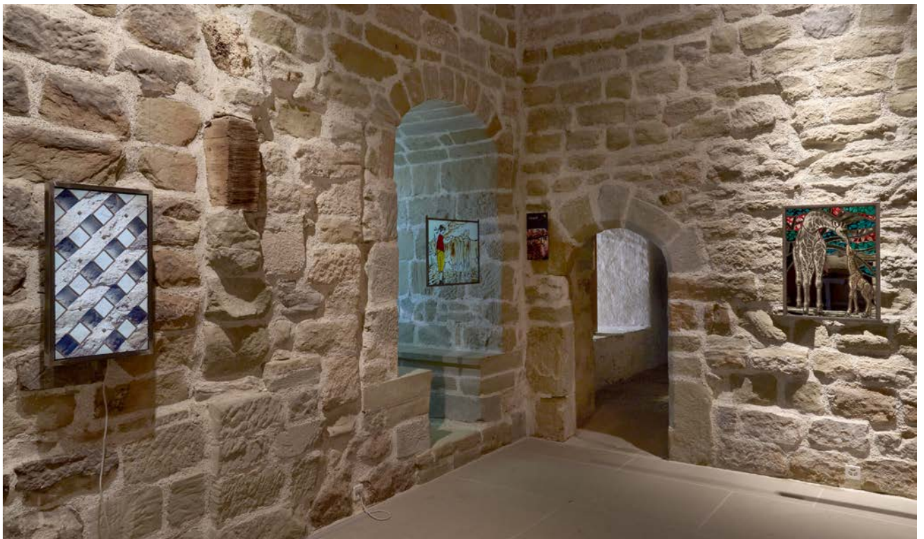
Figs. 2–3. Vues de l'exposition des 30 ans de l'APSV à la salle St-Luc.