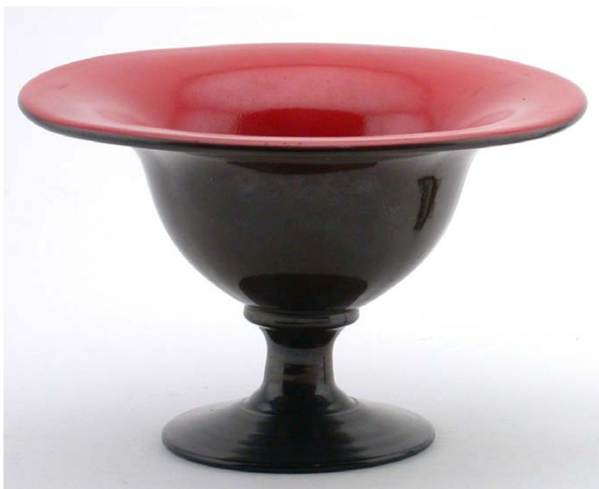
Fig. 9. Verrerie de St-Prex, 1931, coupe émaillée, Musée Ariana, AR 2003-508.

de stile carnevale , issus de la maison Fratelli Toso, sont adoptés à Saint-Prex, notamment pour une coupe à inclusions vertes. D'autres pièces, à inclusions plus fines, présentent des dessins monochromes ou multicolores. Irisées, ces œuvres évoquent les vases de Vittorio Zecchin exposés au Salon d'Automne à Paris en 1922. Un autre style, également attribué aux Fratelli Toso, créé autour de 1900 – le Stile moderno ou Vecchio Murano selon l'époque –, s'exprime à Saint-Prex par un effet marbré rose, irisé. Et n'oublions pas le rigadin , ce décor typiquement vénitien obtenu à l'aide du moule à côtes, qui caractérise certains vases saint-preyards translucides, incolores, verts ou bruns, ainsi que des flûtes à inclusions, proches des vases a strisce verticali présentés par Carlo Scarpa à la IV Triennale di Monza en 1930. Si la réception de l'art verrier vénitien est bien attestée en Europe et aux États-Unis, elle est désormais également documentée en Suisse – à Saint-Prex.