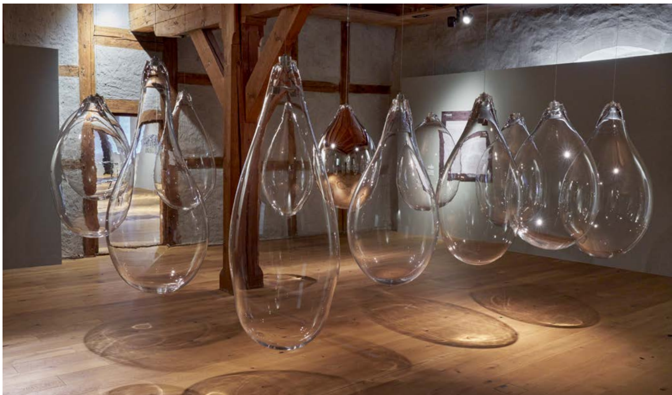
Fig. 3 : Vue de l'exposition « Glasswork » de Matteo Gonet.