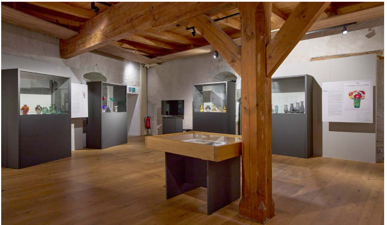
Figs. 2–3. Vues de l'exposition « La Verrerie artistique de Saint-Prex » dans les salles du Vitromusée Romont.