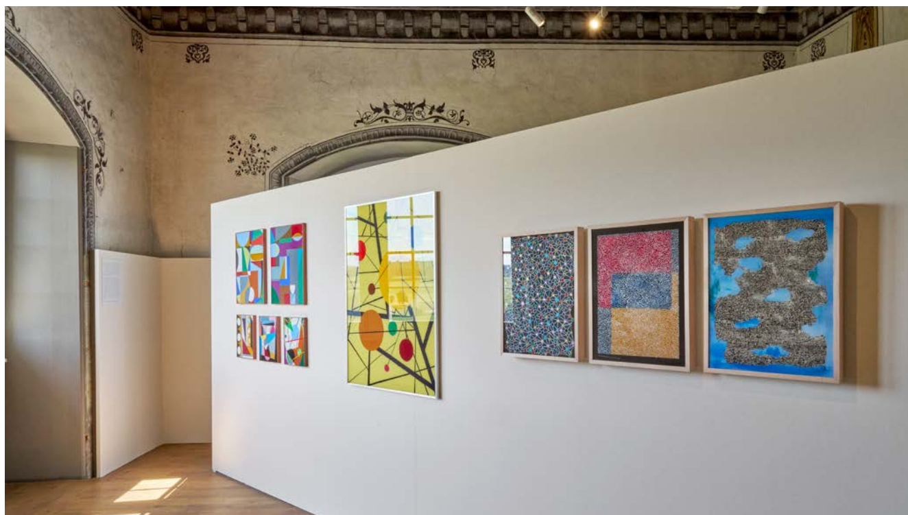
Fig. 1. Vue de l'exposition de Carlo Domeniconi à la Salle des Baillis.

Après un cours préparatoire à la Kunstgewerbeschule de Zurich, Carlo Domeniconi, né à Schaffhouse en 1951, poursuit sa formation artistique à la Scuola Internazionale di Grafica de Venise. D'origine italienne, il s'établit à Vicenza dès 1979, puis, entre 1984 à 1988, à Valence, en Espagne. Il s'installe ensuite à Schaffhouse, où il ouvre son atelier. Il a exposé en Suisse, en Italie, en France, en Allemagne, en Autriche, en Espagne, aux États-Unis et en Chine. Carlo Domeniconi a reçu plusieurs distinctions importantes, le « Manor