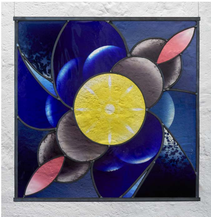
Fig. 3. L'œuvre réalisée par Oksana Kondratyeva exposée au Vitromusée Romont.

porains à travers le Royaume-Uni en tant qu'art architectural. Son travail expérimental sur le verre a été sélectionné pour être exposé à la Biennale britannique du verre 2024. Les vitraux et les peintures de l'artiste ont été présentés dans des publications prestigieuses, dont le magazine Physics World .