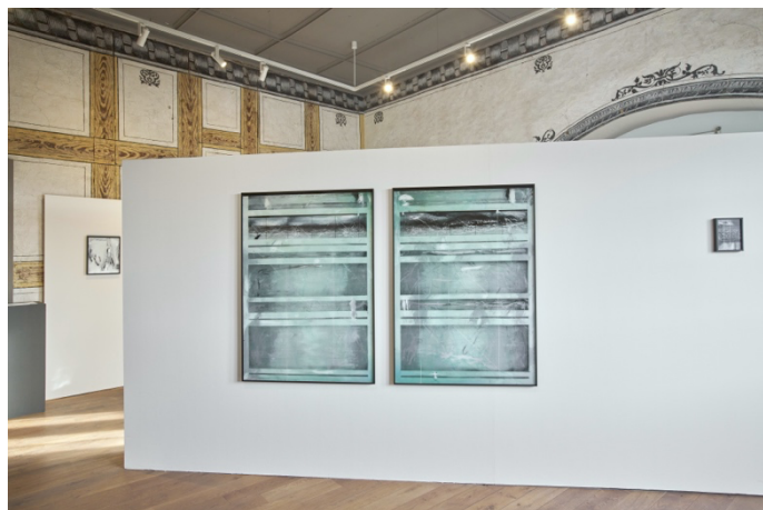
Vue de l'exposition