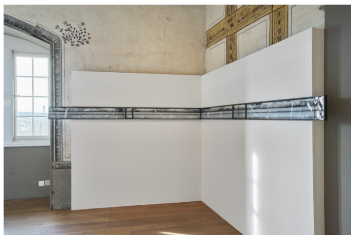
Vue de l'exposition