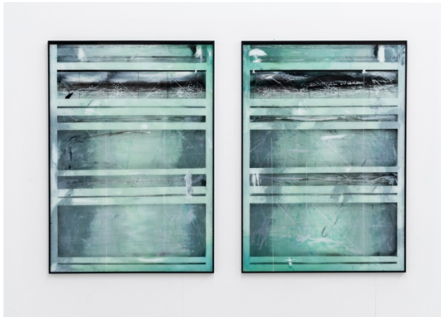
„Untitled“, Oil, spraypaint, reverse glass, framed, each 84 x 120 cm, 2023. © Nico Kurzen