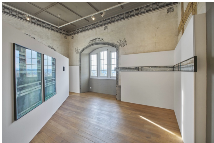
Vue de l'exposition

MUSÉE SUISSE DU VITRAIL ET DES ARTS DU VERRE SCHWEIZERISCHES MUSEUM FÜR GLASMALEREI UND GLASKUNST SWISS MUSEUM OF STAINED GLASS AND GLASS ART