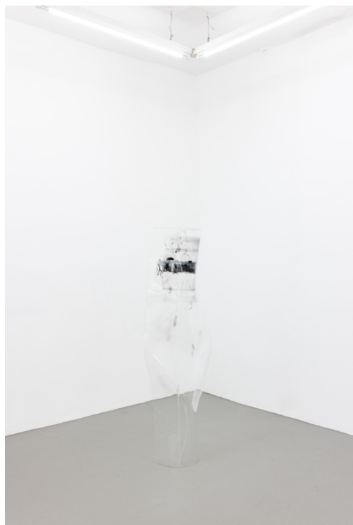
„the forming third“ -series 1.5, approx. 35 x 160 x 25 cm, Oil, spraypaint, reverse curved glass, 2023.