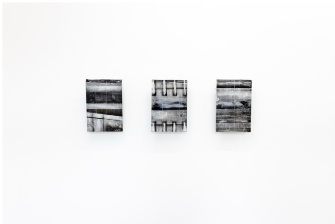
„Untitled“ -series, approx. 24 x 30 x 6 cm, Oil, spraypaint reverse curved glass, aluminium holder, 2023. © Kali Gallery