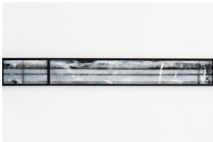
„In my mind, I prefer to be further away“ -series, *variable dimensions, Oil, spraypaint reverse curved glass, framed, 2023© Nico Kurzen